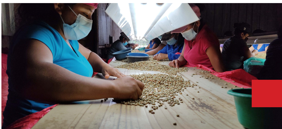
Procesado del café en Honduras

Igualdad de Género en el sector agropecuario